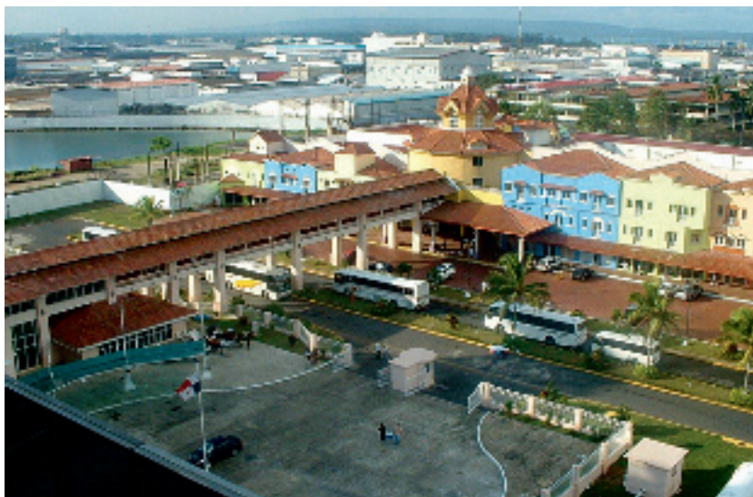
De Vrijhandelszone van Colón (CFZ - Colon Free Zone) bevindt zich op zowat 150 km van Panama City en is de tweede grootste vrijhandelsplaats na Hong Kong. Het is een trekpleister voor import- en exportbedrijven.