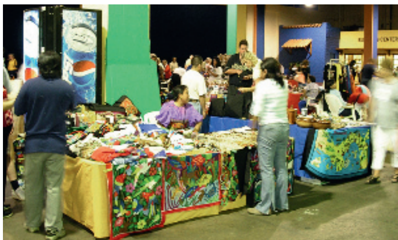
De Panamese economie is voornamelijk gebaseerd op dienstverlening (80% van het BBP). Sinds 1990 maakte de economie een enorme sprong voorwaarts. Het gemiddelde groeipercentage bedroeg +5,4% tussen 1990 en 2007.

er natuurlijk wel Belgische bedrijven aanwezig zijn in Panama, is de Belgische export naar die bestemming vooralsnog heel bescheiden. Volgens Rudi Mertens, die sinds 2001 in Cuba is, zijn daar een aantal redenen voor: "Er spelen culturele en taalkundige aspecten mee. Panama is tegelijkertijd Latijns en geamericaniseerd. Landen zoals Spanje, Italië, Portugal en zelfs Frankrijk exporteren gemakkelijker naar Panama. Toch lijkt het geen twijfel dat Panama (en de landen in Latijns-Amerika in het algemeen) een enorm potentieel bieden voor Belgische investeerders. Zit de regionalisering van het Belgische netwerk er voor iets tussen?" Fabienne L'Hoost , algemeen adjunct-directeur van het Agentschap voor Buitenlandse Handel: "Belgische bedrijven moeten worden aangemoedigd om meer naar verre landen te exporteren.... Vooral in tijden van crisis, wanneer het verzadigingsrisico van de export naar Belgische buurlanden reëel is. Panama biedt daadwerkelijk fraaie marktkansen".