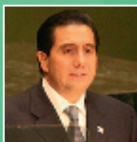
Panama is een parlementaire republiek. President Martin Torrijos werd verkozen op 3 mei 2004.

Klimaat Hoge temperaturen het hele jaar door in het hele land, behalve op grote hoogte. Regenseizoen van mei tot november.