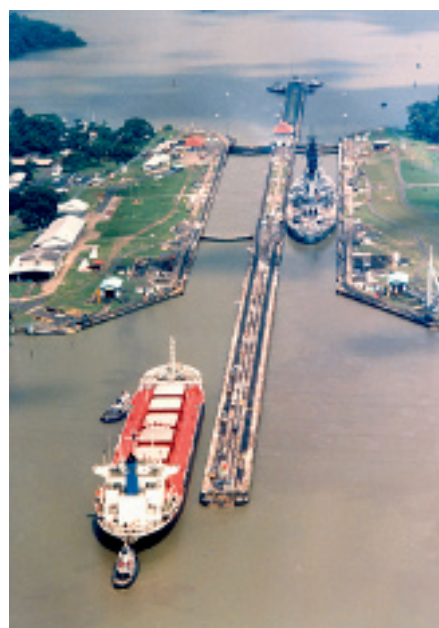
Het Panamakanaal is een strategische ader voor de zeehandel: ongeveer 14.000 schepen varen er jaarlijks langs.

beschikt Panama over zeer weinig grondstoffen: koper is de enige die wordt uitgevoerd. In zijn 'landenficke' legt Patrick Gillard de nadruk op twee minpunten: de corruptie en de drugstrafiek. Corruptie is er in alle domeinen, ook in de openbare sector (zowel in de uitvoerende en wetgevende als in de juridi-